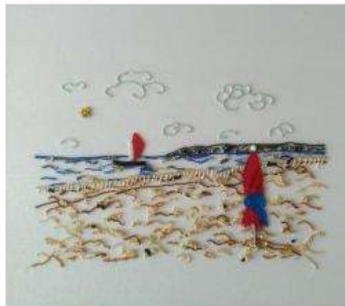
Stage personnalisé (selon votre dessin)