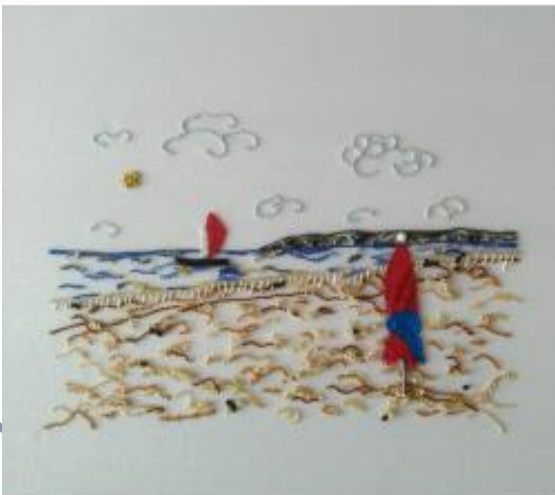
Stage personnalisé (selon votre dessin)