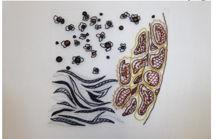
2-J't'ai dans la peau