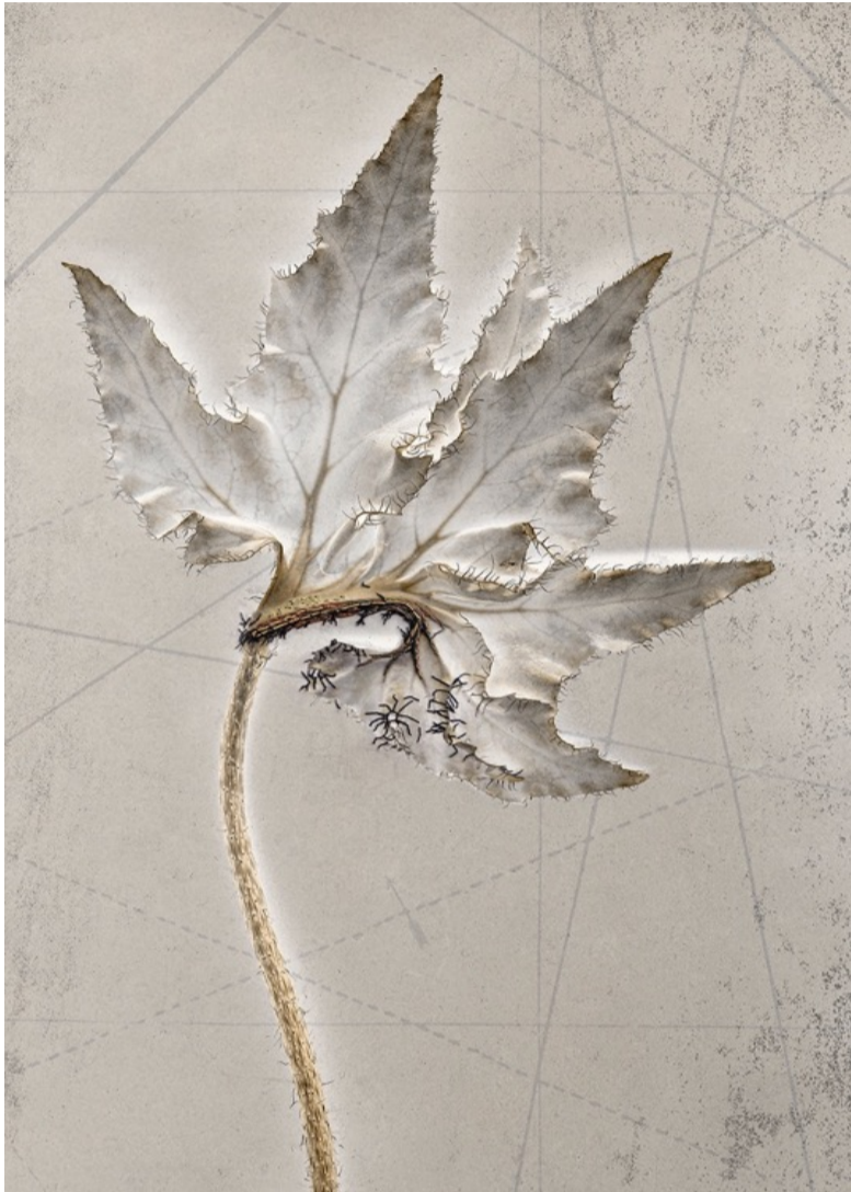
SOPHIE ZÉNON, 'HÉLÈNE JAROS & LIME SWIRL' ROUGE SPIRALE. BRODERIE : SYLVIE DESCHAMPS 2025.

Composition photographique sur papier japon. Photographie d'une feuille de bégonia et détail d'une carte marine du XVII e siècle.