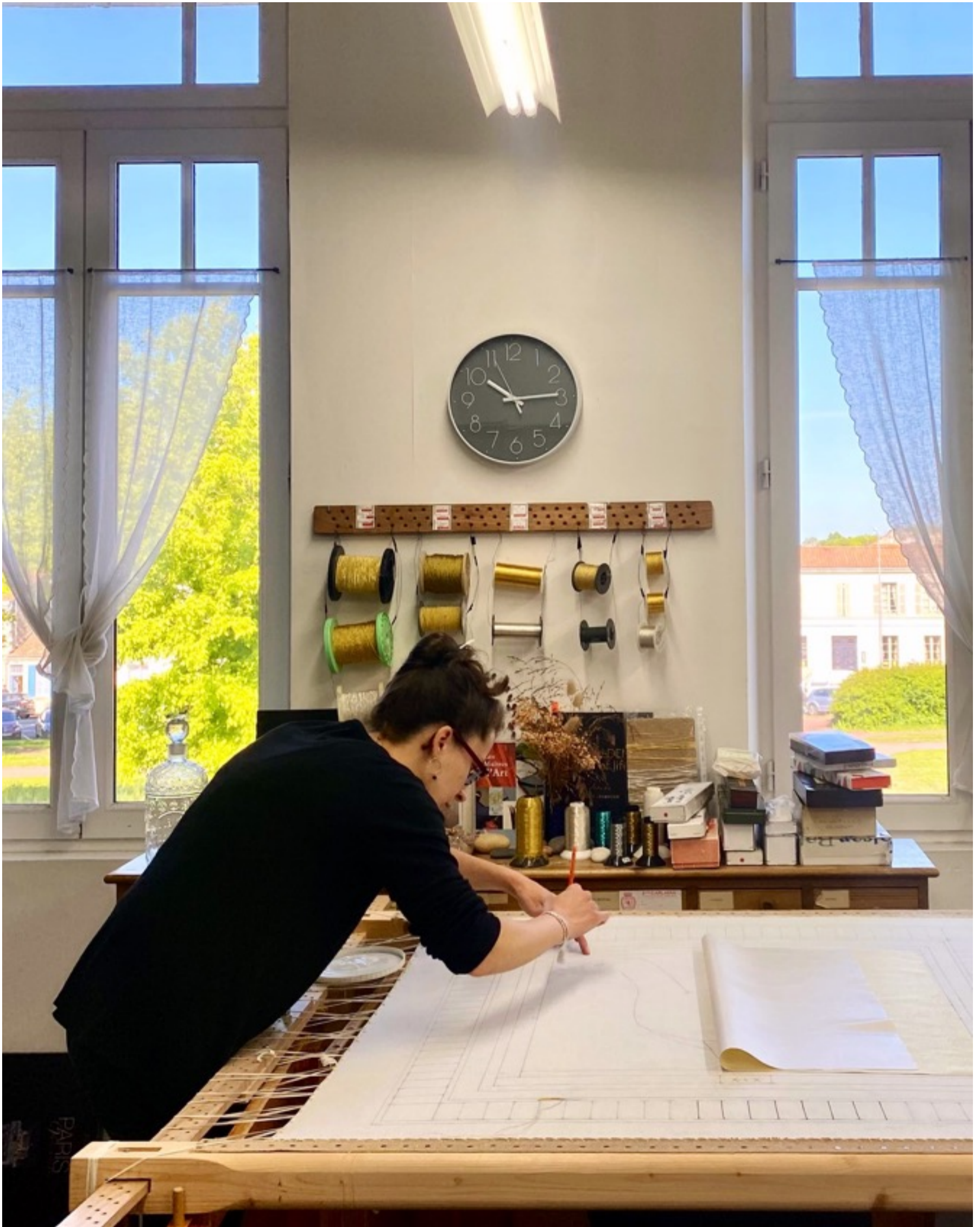
L'atelier du Bégonia d'Or à Rochefort