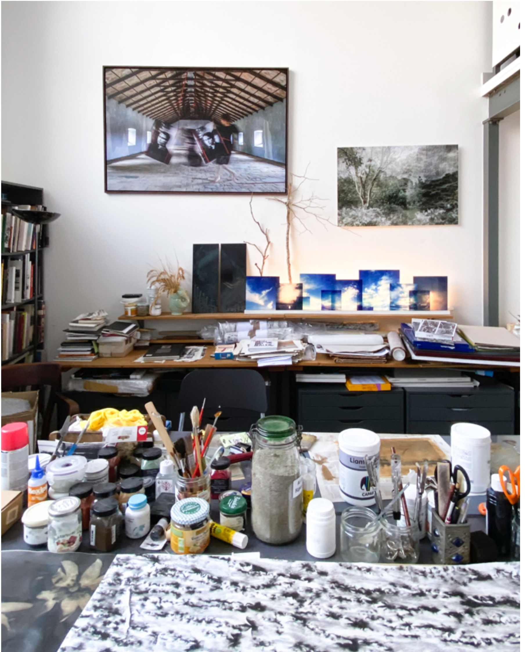
L'atelier de Sophie Zénon à la Villa des Arts à Paris.